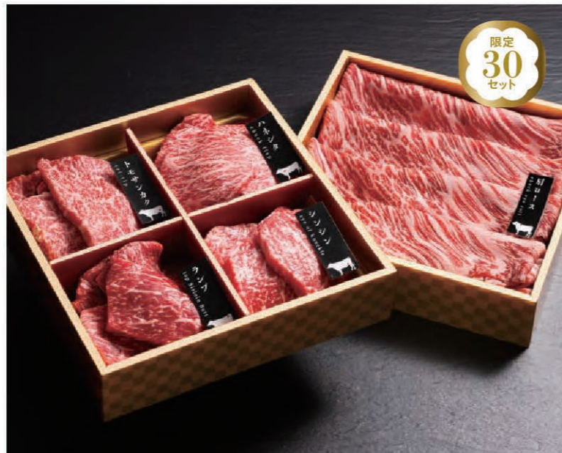
※画像のオスメの4種は一例となります。

この商品は、以下の受注締切日、発送日を設けております。 数量に達し次第、締切期限問わず終了とさせていただきます。